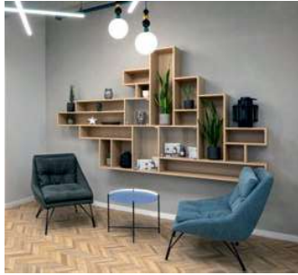
למעלה: פינת ישיבה א-פורמלית / מבואת כניסה לאזור המעבודות. למטה: מחיצה אזורית עשויה רשתות מפרידה בין אזורי העבודה למעבר הציבורי.